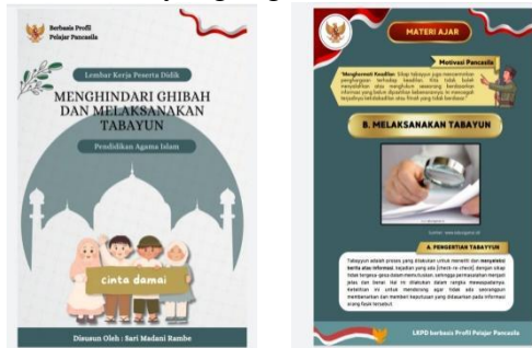
Gambar 2. Modul PAI berbasis nilai-nilai profil pelajar pancasila

Bagian penutup berisi tentang evaluasi, refleksi dan daftar pustaka. Evaluasi meminta siswa untuk memberikan kesimpulan dari pembelajaran yang telah dilakukan, lalu menanyakan apa pelajaran yang di dapat dalam kehidupan sehari-hari dengan menerapkan materi ajar tersebut. Modul ini di tutup dengan daftar pustaka berupa referensi yang digunakan dalam menyusun modul.