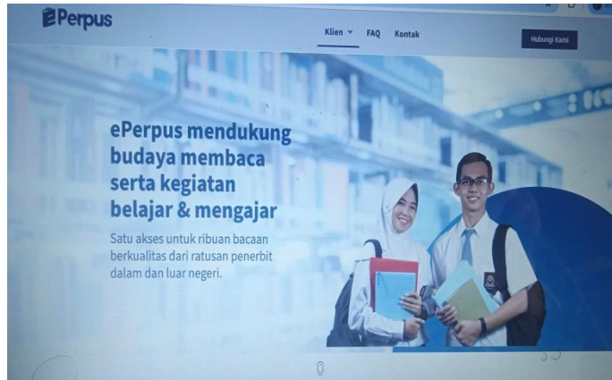
Gambar 2. e-Perpus (Perpustakaan Digital Gramedia)

Ada pula E-Perpus yaitu layanan perpustakaan digital yang memiliki konsep B2B ( Business-to-Business ) yang dikembangkan oleh Gramedia.